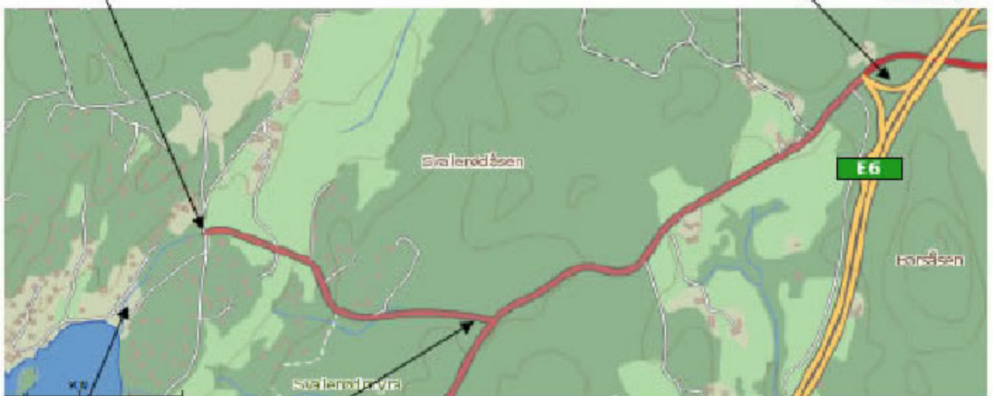
Her er hytten